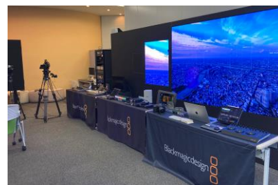
前回のイベント時写真